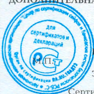
Схема сертификации - 1с